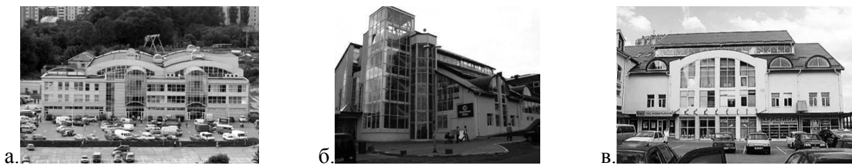
Рис. 1. Ринок «Шувар» у м.Львові:

У мікрорайоні Сихів зведено такі торговельні комплекси: “Зубра центр” на вул. Сихівській, 5 (арх. А. Ващак, В. Каменщик, Є. Мінкова, 1994 р.), т.з. “Верхній Шувар” та “Нижній Шувар” (рис. 1). Архітектурний пошук торговельних комплексів “Шувар” здійснено в дусі традиціоналізму, хоч, безперечно, як автори, так і власники намагались надати будівлям новаторського образу, використовуючи скляні поверхні. Простежується звернення до локальної історичної архітектурної ідентичності у “Зубра центрі”, що вирізняє будівлю з навколишньої забудови, яка є репрезентацією радянської ідентичності.