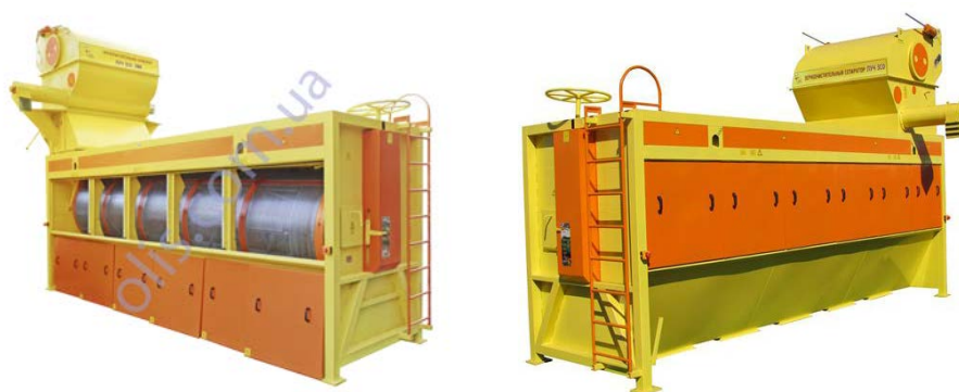
Рис. 2. Сепаратор ЗСО ЛУЧ барабанного типу ТОВ «ОЛІС»

Окремо треба виділити роторний сепаратор PROF SEED німецької фірми RIELA (рис. 3). Він складається з пневматичного сепаратора і набору барабанних вертикально розміщених решет. Забруднене зерно (1) через роздільник (2) подається на барабани, які складаються з внутрішнього та зовнішнього решет (3). Вони працюють за принципом планетного руху, тобто обертаються навколо своєї осі та одночасно навколо вісі машини. Під дією відцентрової сили зерно відкидається на зовнішні решета. Більші домішки затримуються на внутрішніх решетах (4), а дрібніші - на зовнішніх (5). Потім очищене зерно по каналах (6) потрапляє до вивідних отворів (7). Звідти очищений матеріал проходить через повітряний сепаратор AIR SEED (8), де