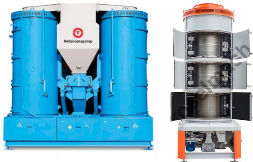
Рис. 4. Сепаратор Р8-БЦСМ-50 [7]

Одним із способів інтенсифікації процесу сепарування зерна є використання додаткового силового поля при здійсненні вібраційного і обертального руху робочих органів. Такий спосіб використовується в зернових сепараторах барабанно-вібраційного типу А1-БЦСМ-100 та Р8-БЦСМ-50 (рис. 4).