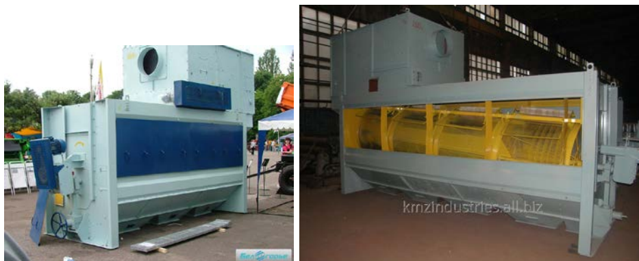
Рис. 1. Сепаратор КБС барабанного типу

аналогом сепаратора фірми MAROT [4]. ТОВ «ОЛІС» (м. Одеса) освоїло виробництво широкого типорозмірного ряду сепараторів барабанного типу ЗСО ЛУЧ [5], продуктивністю від 25 до 300 т/год (рис. 2). Закордонними виробниками сепараторів барабанного типу є фірми DENIS (Франція), MAROT (Франція), Mulmix (Італія), СПОМАШ (Польща).