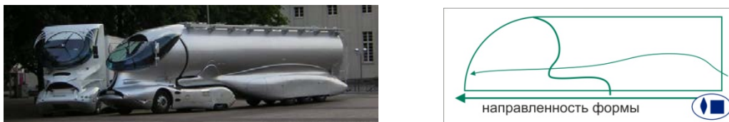
Рис.1 «Схема линейной основы формообразования объекта»

составляются заключение о соответствии, или не соответствии предъявляемым требованиям к дизайн-объекту транспортного средства специального назначения.