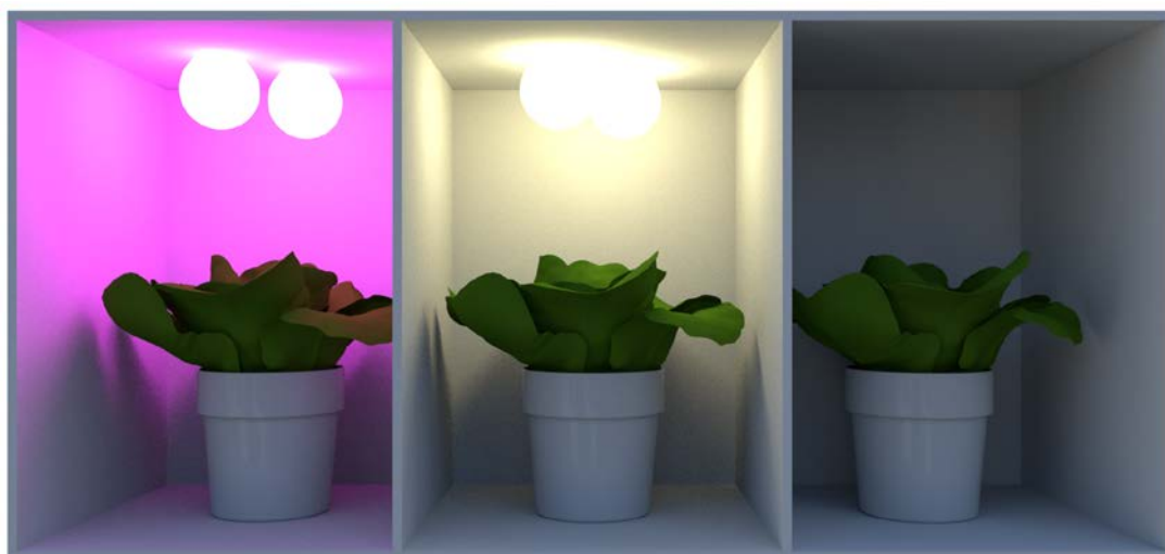
Рис. 5. 3D модель экспериментальной установки

Экспериментальная установка состоит из трех изолированных друг от друга боксов размерами 25x25x35, выкрашенных белой краской с коэффициентом отражения \rho=0,8 . У каждого из боксов будет отсутствовать передняя стенка для поступления естественного света. Для первого и второго экспериментальных вариантов в крышке установки смонтированы по две светодиодные лампы для искусственной досветки. Автоматизированная система управления искусственной досветкой располагается на торцевой стенке установки (рис.2).