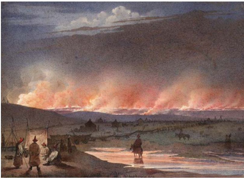
Рис. 1. Акварель Т.Шевченка

Так, одне з найпочесніших місць в світовому акварельному мистецтві займає творчий доробок Тараса Григоровича Шевченка [9] (рис. 1, 2).