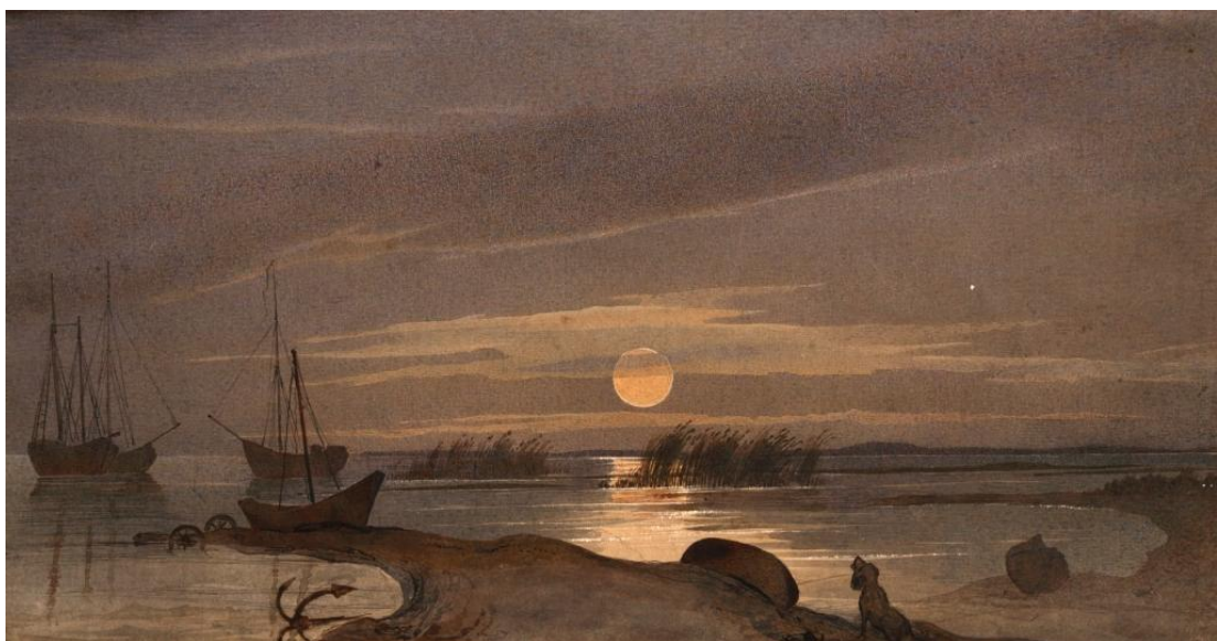
Рис. 2. Акварель Т.Шевченка